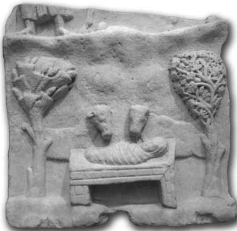
Presepe in marmo di epoca bizantina

meritare." Oggi mi chiedo: "Cosa devo fare per guadagnarci la dignità e non meritare la miseria?" Guardo a destra e vedo nero, a sinistra ancora nero, ma dentro di me c'è la luce! Sapete cosa manca alla società moderna e ai gio-