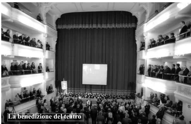
La benedizione del teatro

Canosa ha riottenuto, in pompa magna, un patrimonio che è mancato per troppo tempo ad una Comunità che, tuttavia, non ha potuto ancora apprezzarlo del tutto. Chiunque sia riuscito a visionare in ogni sfaccettatura i fregi e i pavimenti, dotato magari di inviti e pass vari, non deve dimenticare di non essere affatto superiore a chi attende tuttora trepidante di sedere sulle poltrone o affacciarsi alle balconate. L' "Io c'ero" è fonte di soddisfazione, ma non di egoismo: questo Teatro deve appartenere a tutti. I delusi che facevano capolino dalle porte lo stanno ancora aspettando.