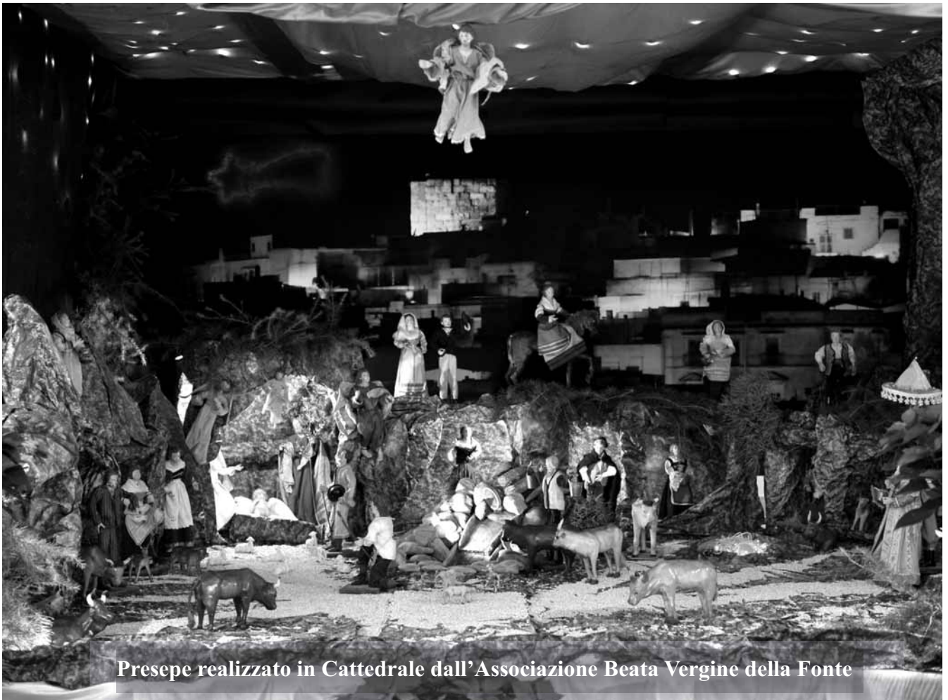
Presepe realizzato in Cattedrale dall'Associazione Beata Vergine della Fonte

Canosa di Puglia - Anno XVIII n. 6 - Dicembre/Gennaio 2011