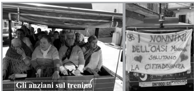
Gli anziani sul trenino