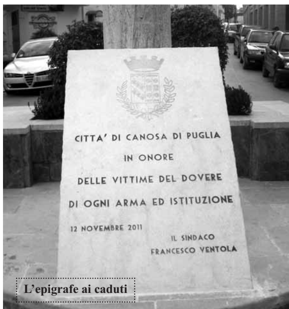
L'epigrafe ai caduti

Se poi non c'è posto a pagamento, non devi assolutamente prenderti pena, a Piazza Terme ci sono dei passi carrabili, lì c'è posto, però sempre con il lampeggio; chi deve entrare nel garage aspetterà, deve imparare ad avere pazienza, chi vuole abitare al centro deve pagare lo scotto di abitare al centro: è cosa di un minuto e se lasci qualche figlioletto a bordo, correranno a chiamarti, faranno un po' più di rumore i clacson, potrà arrivare anche qualche vigile, che rimprovererà il condomino che ha fatto chiasso e non ha permesso il passaggio delle altre macchine, tu impara, di soltanto "un minuto, mi dispiace e fai la faccia contrita". Ci sono quelli più furbi che si sono forniti di un bel tagliando "invalido", lo piazzano sul cruscotto e stazionano dove vogliono. Nel tuo giro del lampeggio certamente ti incontrerò in Via Barletta, nelle vicinanze dell'ospedale, proprio là dove il traffico dovrebbe essere più scorrevole per la probabilità del passaggio delle ambulanze o di macchine di pronto soccorso, proprio là la legge del lampeggio e anche del non lampeggio è imperante. Hanno messo anche un vigile ma appena il vigile va via, la legge del lampeggio ritorna a comandare. E' proprio una malattia, un veleno, ma non è stato ancora trovato l'antidoto. Auguri, comunque, amico del lampeggio, capita a tutti di doverlo usare!!!