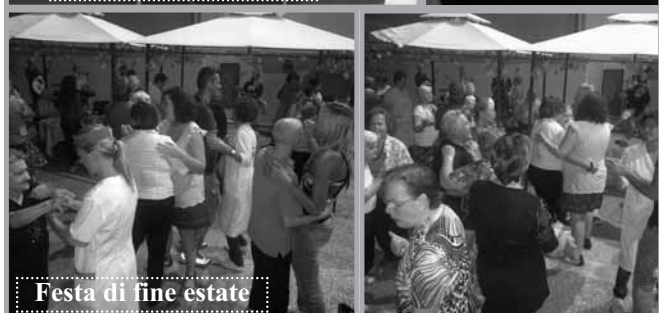
Festa di fine estate