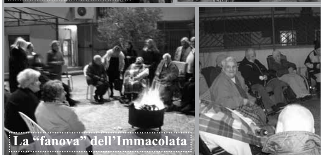
La "fanova" dell'Immacolata