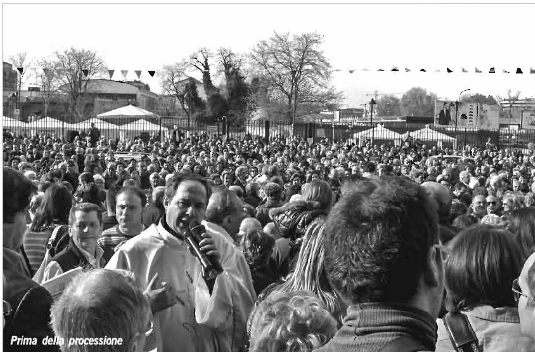
Prima della processione