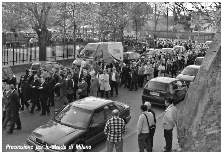
Processione per le strade di Milano

Orruet na' lett-r da canàus! Jajj ù sin-ch ! C'è d-cj ? "Cara-mocjj tè ja d-cjj nà caus! Ven San-zav-n da canaus!!! Ven a M-lèn, alla Bar-n, andò stann tutt li canus-n! C'è bbella nutizj jà quess, quand'ann sò can ò vat?? Mbè so na trnd-n!!! Agghjà v'-nj! Cur jurn agghjà purtej tutt li figghj e li 'n-peut. D' San-zav-n lè semb parlet, ma mej a canàus li so purtet.