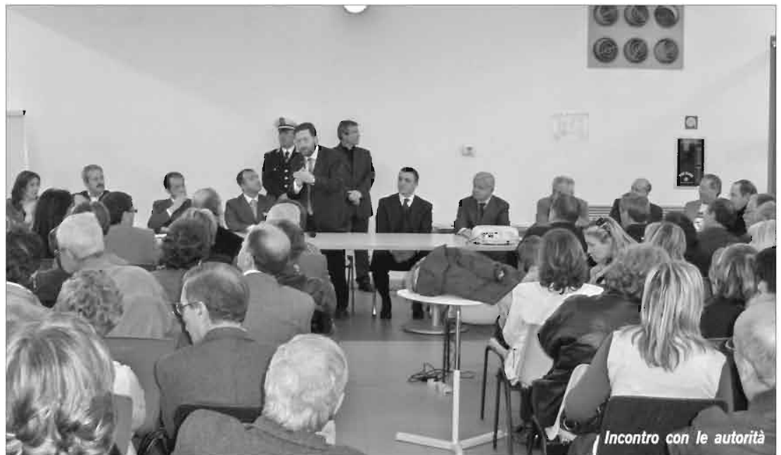
Incontro con le autorità

I fuochi pirotecnici allestiti da un artigiano canosino hanno completato la festosa manifestazione di fede dando l'impressione di essere a Canosa alla festa patronale. Con un'ancor più felice conclusione abbiamo riconsegnato il Venerato Simulacro alla stima e all'affetto di tanti canosini che puntualmente attendevano il ritorno del Santo Patrono. Grati al nostro Dio che è Amore e ci